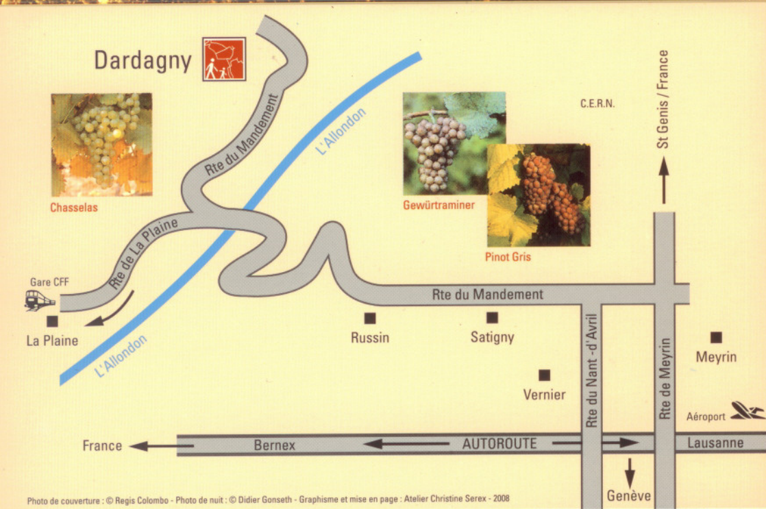
Graphisme et mise en page : Atelier Christine Serex - 2008