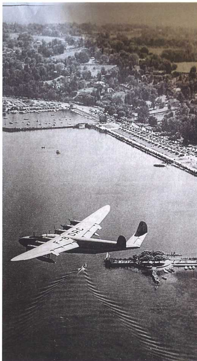
L'hydravion géant survole la rade de Genève. Il s'abîmera dans l'Atlantique entre la Martinique et Paris quelques mois plus tard.