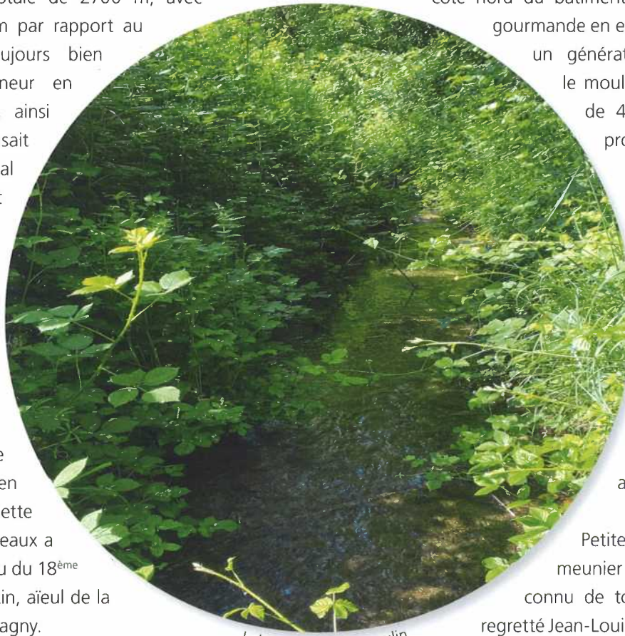
le bief derrière le moulin