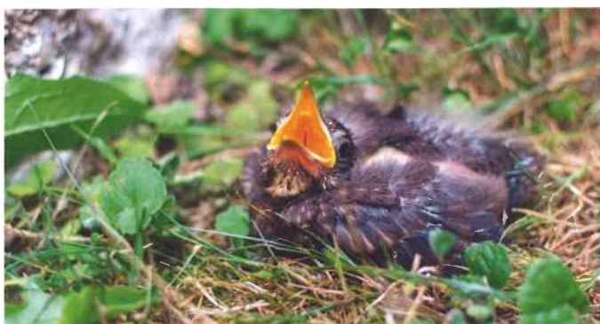
Merle noir juvénile, avec des parties de chair rose. Dans ce cas-là, il faut intervenir.

L e printemps est de retour, et avec lui, le risque de rencontrer un oisillon au sol. Connaissez-vous les gestes à adopter dans cette situation? D'abord, observez l'oisillon. Vous pouvez, éventuellement, le manipuler pour voir s'il est blessé. En effet, contrairement aux mammifères, les oiseaux n'ont pas l'odorat développé et n'abandonneront pas leurs petits. Si vous êtes en présence d'un oisillon tout emplumé, avec un petit bout de queue, reposez-le sous un couvert végétal pas loin d'où vous l'avez trouvé. Attention, certaines espèces ne nourrissent plus leurs petits une fois au sol (Martinets noir et Hirondelles).